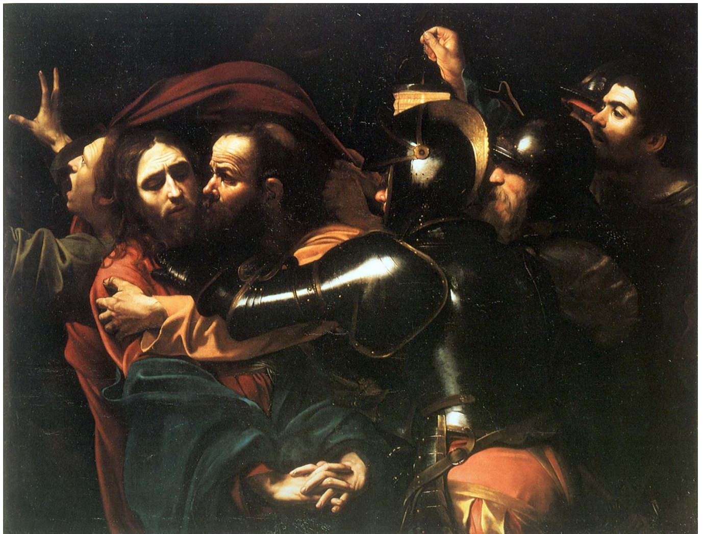
Cattura di Cristo

“...sono stato preso all’istante dalla forza delle immagini, dall’azione nelle inquadrature, dal modo in cui concepiva la composizione ed il soggetto: non c’era dubbio che si potesse portarlo nel cinema, per l’uso della luce e dell’ombra, l’effetto chiaroscuro era proprio come la messa in scena moderna nel cinema.