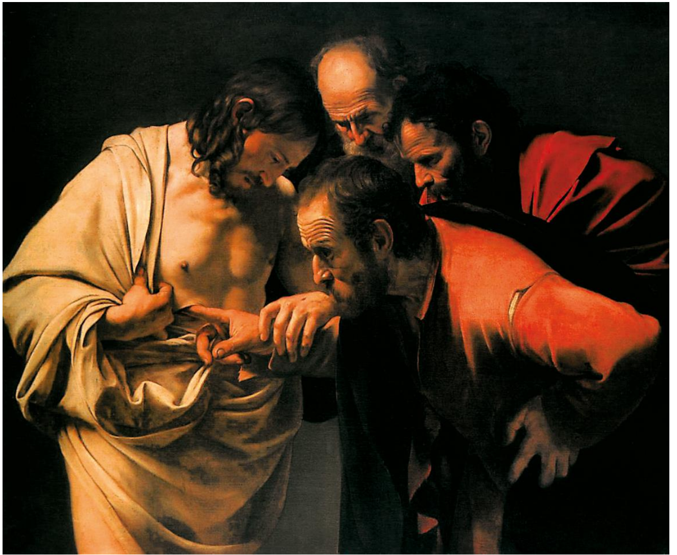
Incredulità di San Tommaso

"PERCHE' LE IDEE NEI ROGHI NON BRUCIANO"