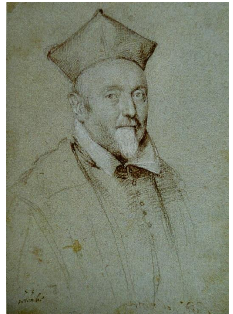
Cardinal Del Monte